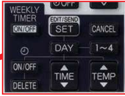
Пример использования таймера: зима/режим нагрева

1 Режим работы не может быть изменен по таймеру.